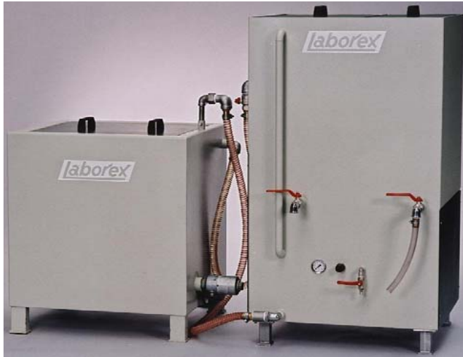
olieafscheider type I / type II