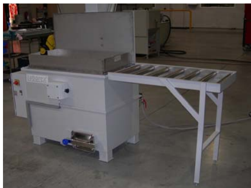
laad- / lostafel

Bijkomende opties steeds verkrijgbaar op aanvraag.