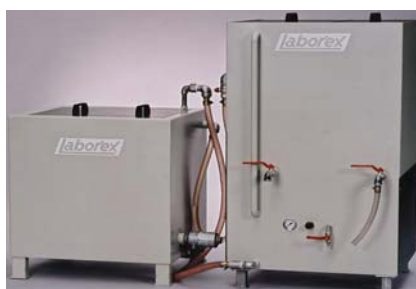
olieafscheider type II