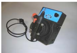
elektrische en mechanische doseerpomp