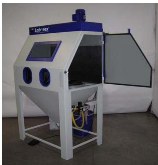
type 1000 / 1250