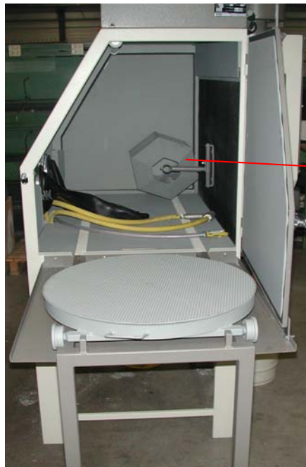
trommel met reductiemotor