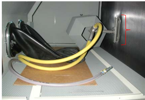
regelbaar statief voor pistool