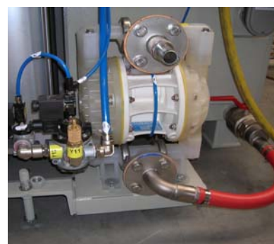
pompe de vidange