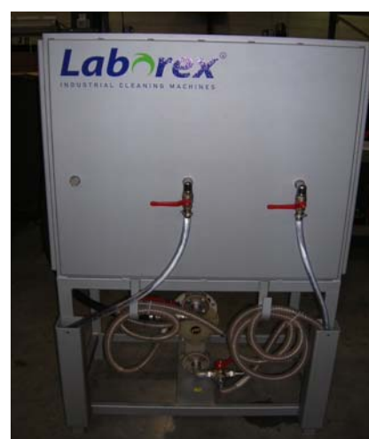
séparateur de graisse