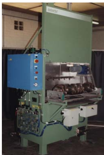
porte guillotine pneumatique