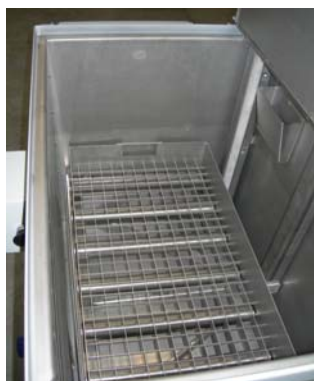
convoyeur à rouleaux interne