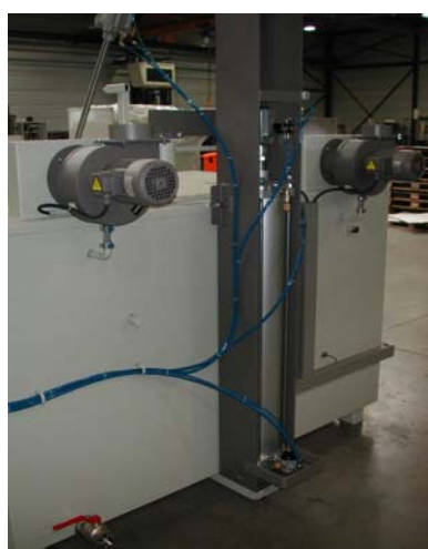
évacuation de vapeurs